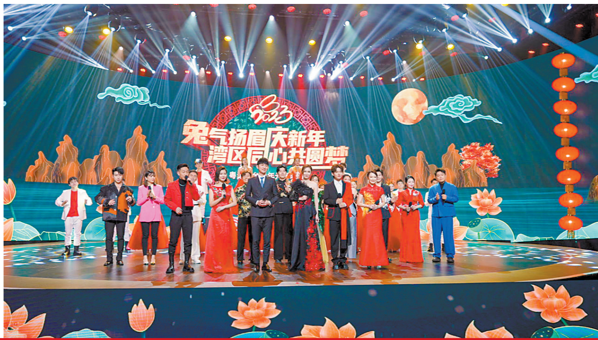
2023粤港澳大湾区青年元宵晚会今晚播出

兔 气扬眉庆新年，湾区同心共圆梦。“2023粤港澳大湾区青年元宵晚会”于2月5日19时30分播出，届时包括羊城晚报·羊城派在内的多个平台将进行直播。晚会由广东海外联谊会、广东广播电视台主办，广东省人民政府台湾事务办公室、广东省人民政府港澳事务办公室、香港中联办广东联络部、澳门中联办广东联络部等协办，将围绕“国风”“穿越”“科幻”等元素，汇聚来自粤港澳大湾区四地的演艺明星和青年才俊，共同献上一场有年味、有韵味、有家味、有青春味的元宵视听盛宴。