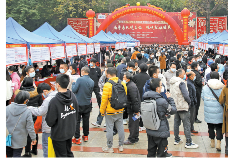
韶关兔年首场大型线下招聘会现场