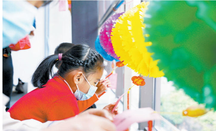
市民在南粤先贤馆体验民俗游戏猜灯谜

羊城晚报讯 记者李春炜、通讯员詹萃萃报道：4日，“好运成兔(TWO)”国潮游园会在广州市越秀区文化馆和南粤先贤馆举办。两馆携手广