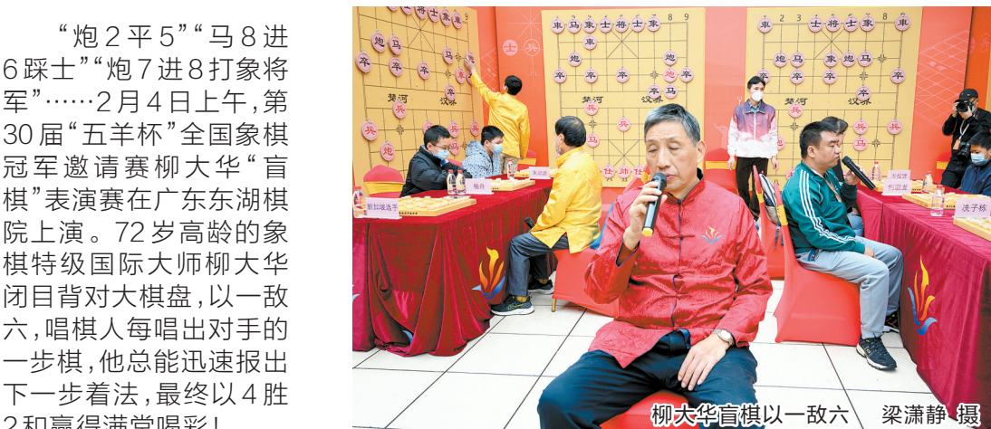
柳大华盲棋以一敌六

“炮2平5”“马8进6踩士”“炮7进8打象将军”……2月4日上午，第30届“五羊杯”全国象棋冠军邀请赛柳大华“盲棋”表演赛在广东东湖棋院上演。72岁高龄的象棋特级国际大师柳大华闭目背对大棋盘，以一敌六，唱棋人每唱出对手的一步棋，他总能迅速报出下一步着法，最终以4胜2和赢得满堂喝彩！ 盲棋又称闭目棋，是指眼睛不看棋盘、手不摸棋子，以唱棋的形式与人对弈。盲棋对棋手的记忆力与抽象思维能力要求很高。柳大华一向以记忆力超群著称，1995年在北京曾创下1对19人的闭目棋纪录，赢得了“东方电脑”的美誉。如今他除了在直播间表演盲棋外，还经常在全国各地一些象棋活动表演闭目棋。2022年在重庆，柳大华就曾再度上演闭目棋绝技，同时下11盘棋，一盘没输一步没错。 第30届“五羊杯”也在第四个比赛日安排了精彩的1对6盲棋赛。老少棋迷冒雨前来，有坐着轮椅的耄耋老人，也有天真烂漫的学棋儿童。淅淅沥沥的小雨没有浇灭羊城棋迷对“五羊杯”的热情。当柳大华现身时，棋迷更是情绪高涨，掌声不断。 比赛开始，柳大华坐定中央，气定神闲。一盘接着一盘的唱棋声刚落，柳大华便不假思索地念出下一步棋，超群的记忆力和精湛的棋技令现场观众叹服。比赛过程中，柳大华更是将赛场变成直播间，“马踩象的攻势很巧妙，但是我多算一步，一平三的时候知道会出现这种棋，算了一下才走出一平四。”“车九进一是对的，防我杀招，不过他丢得太多了……”如此高强度的对弈，柳大华竟然还有精力向现场棋迷讲解棋路，令棋迷朋友既惊喜又感动。现场喝彩声、赞叹声、笑声此起彼伏。