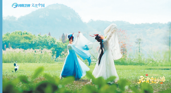
《瑞鹤归》在肇庆实景拍摄