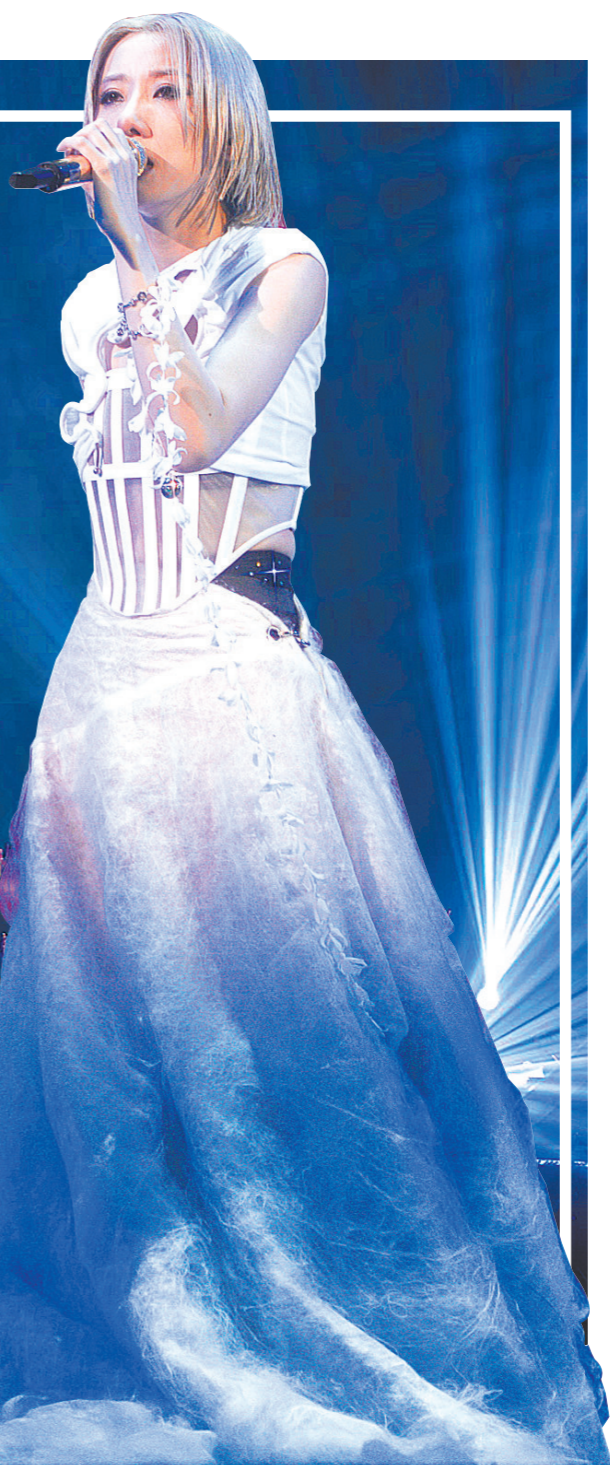
泳儿在香港站演唱会深情献唱