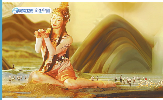
舞蹈《中国神话·女媧补天》画面瑰丽

值得一提的是，在广东肇庆实景拍摄的舞蹈《瑞鹤归》在明代篇章中登场。白鹤点睛复活，翱翔于山河之间化身玉面书生，翩翩起舞在肇庆山河之中，呈现山河景色变幻。主创团队解读：“瑞鹤飞越古今，在元宵佳节，飞入祠堂院落，现代人正在以世代相传的方式，聚在一起，点灯、舞狮、举杯共庆这个吉庆团聚的日子。”据了解，此次河南卫视和广东肇庆在文旅融合方面的创新得到了广泛好评，接下来，“中国节日”系列节目将继续努力深入开拓文旅融合的新局面。