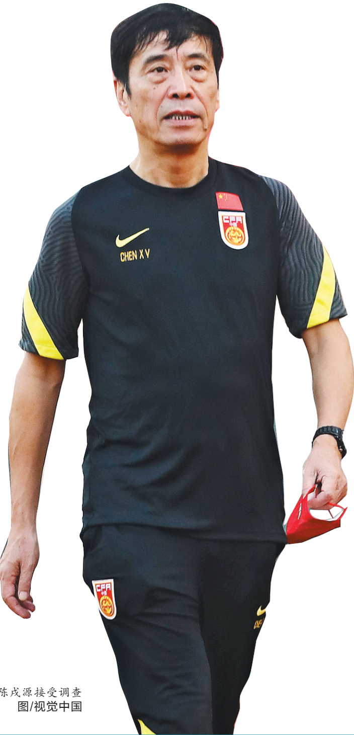
陈戌源接受调查