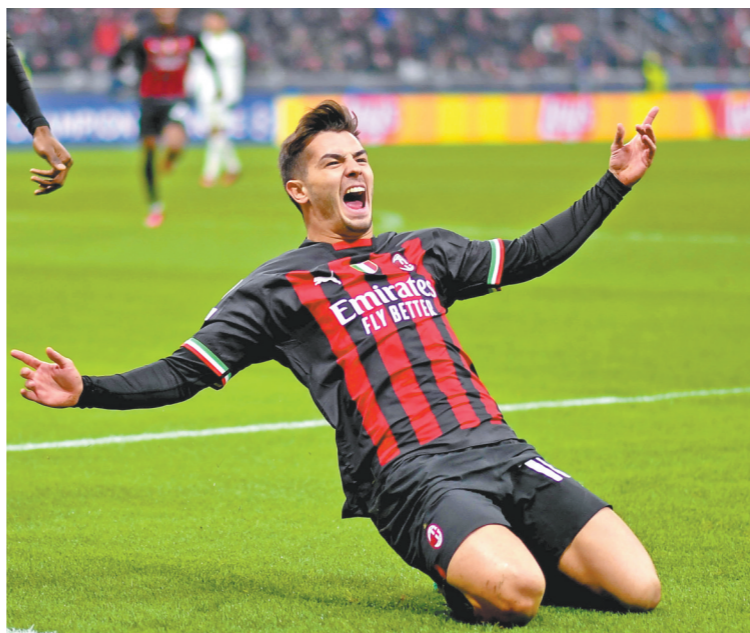
迪亚斯进球后庆祝