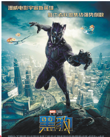
首部《黑豹》在内地票房表现不错

漫威宇宙第三阶段的作品,由2016年的《美国队长3:内战》拉开序幕,此外还包括《奇异博士》《银河护卫队2》《蜘蛛侠:英雄归来》《雷神3:诸神黄昏》《黑豹》《复仇者联盟3:无限战争》《蚁人2:黄蜂女现身》《惊奇队长》《复仇者联盟4:终局之战》《蜘蛛侠:英雄远征》,总共11部,阵容十分庞大。通过这些作品,漫威宇宙继续一边加入新主线,一边将已有超级英雄进行“大乱斗”。