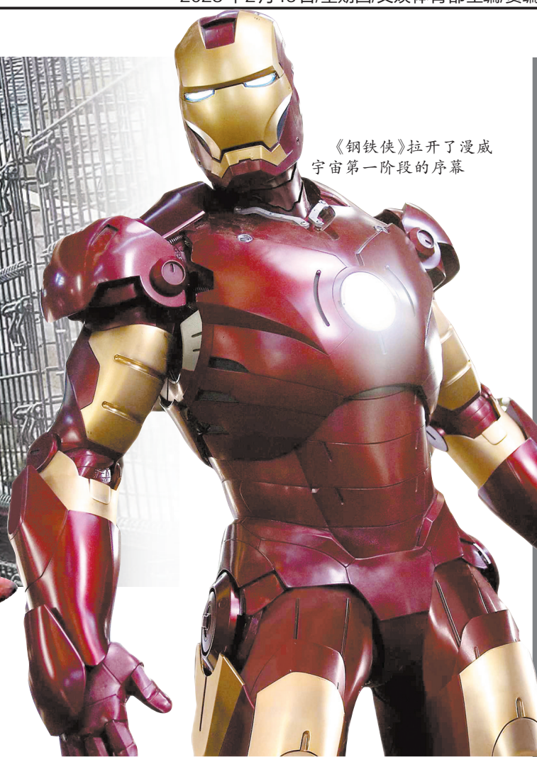
《钢铁侠》拉开了漫威宇宙第一阶段的序幕