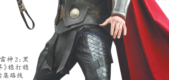
《雷神2:黑暗世界》稳打稳扎走续集路线