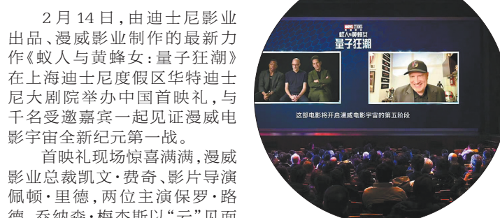
主创以“云”见面方式亮相

2月14日,由迪士尼影业出品、漫威影业制作的最新力作《蚁人与黄蜂女:量子狂潮》在上海迪士尼度假区华特迪士尼大剧院举办中国首映礼,与千名受邀嘉宾一起见证漫威电影宇宙全新纪元第一战。