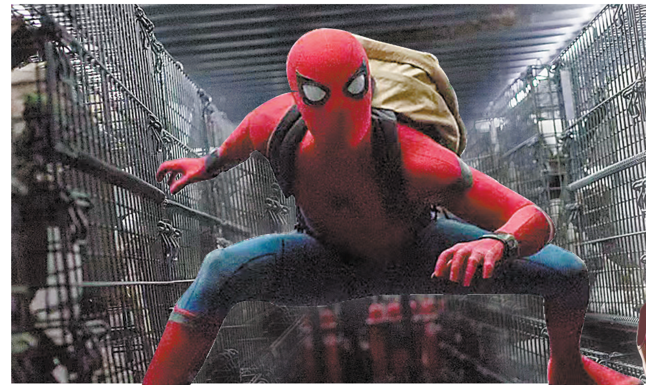
第三阶段《蜘蛛侠：英雄归来》等影片赚得盆满钵满