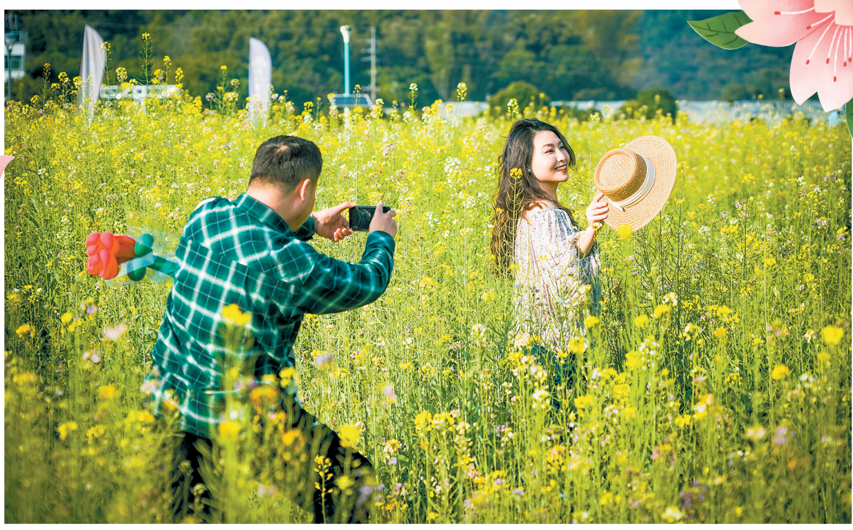
广州黄埔区迳下村油菜花田成为网红打卡点

羊城晚报讯 记者陈秋明、贺全胜报道：乍暖还寒的早春里，广州又变成了花的海洋，大街小巷，阡陌乡村随处可见鲜花绽放，浪漫的春花盛会这两天拉开了序幕。