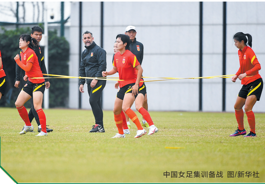
中国女足集训备战