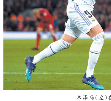
本泽马(左)在比赛中庆祝进球

利物浦打出梦幻开局,第4分钟就由萨拉赫妙传,努涅斯潇洒的“狮子摆尾”脚后跟射门破门。此后,皇马门将库尔图瓦门前玩火,停球失误给就在眼前的萨拉赫“送礼”,被对方挑射破门。此时不过战至第14分钟,皇马就两球落后。