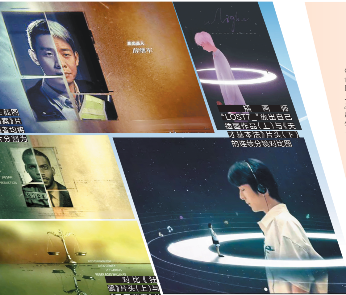
对比《狂飙》片头(上)与《无妄档案》片头(下),构图思路和色调运用颇为相似