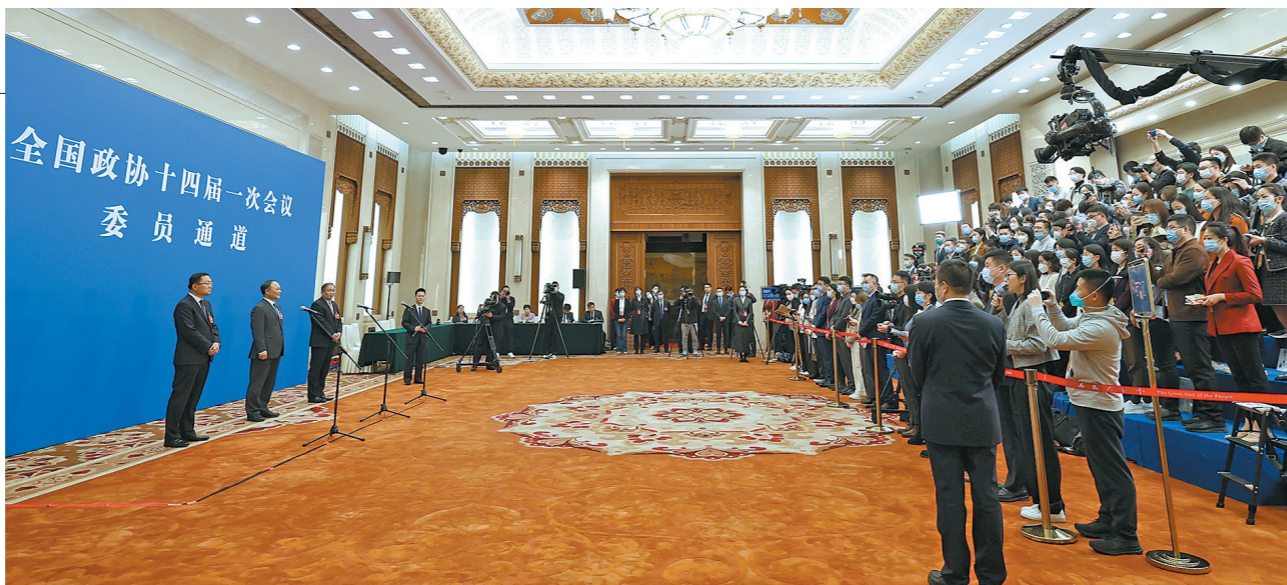
首场“委员通道”集体采访活动在北京人民大会堂新闻发布厅举行

3月4日下午，全国政协十四届一次会议首场“委员通道”集体采访活动在人民大会堂举行。8位全国政协委员亮相“委员通道”，从制造业、文化、基层卫生体系建设、进一步推进高水平对外开放等角度讲述中国故事。