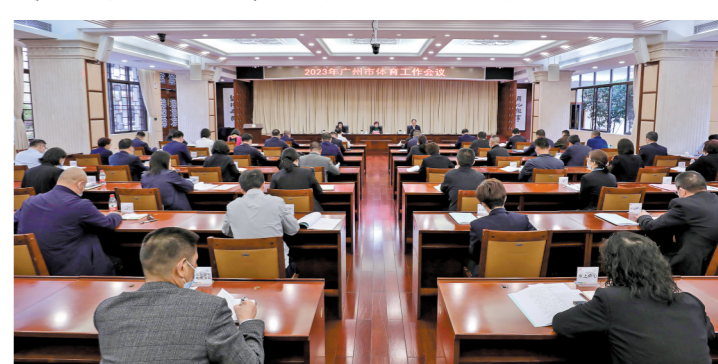
会议现场

育消费；积极谋划市、区高端赛事布局，精心打造大赛品牌。要聚焦核心引擎，完善湾区城市体育创新发展顶层规划设计。支持南沙承办第十五届全运会比赛项目和重要活动，引领粤港澳大湾区体育携手合作、创新发展。