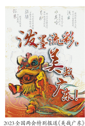
2023全国两会特别报道《美哉广东》

胸怀国之大者，心系民之所向。2022年以来，羊城派紧扣党的二十大大主题主线，推出一个个精品力作，擘画一幅幅波澜壮阔、触动人心的发展新画卷。 党的二十大大开幕前夕，羊城派推出《奋进新时代·非凡十年看广东》系列融媒体策划报道，以气势恢宏的政论《大道之行向复兴——迎接党的二十大大胜利召开》开篇，涵盖手绘长卷、创意动画、互动H5等多种产品形态；后续推出独家策划《中央党校教授谈二十大大报告》《国际友人眼中的中国》系列报道，《必由之路》理论