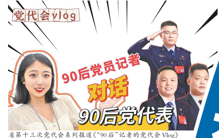
省第十三次党代会系列报道《“90后”记者的党代会Vlog》

现美好。 我们捕捉东山柏园、番禺观海楼新闻线索，牵头推动文化旧址的修缮活化；独家直击北宋东京州桥考古现场，叩问千年繁华旧景…… 我们新创“名家说名作”“走进名家编工作室”等精品栏目，探寻珍品渊源，展示大师风采，讲述出版人背后故事；《岭南24节气》栏目则将广东风物入诗入画，发掘属于岭南时序的气韵与浪漫…… 立足文化领域移动传播优势，羊城派以“文化端”为己任，力推岭南文化“双创”工程，构建内外宣联动体系，持续扩大《岭南文脉》等九大“文脉”和《岭南文史》全媒体品牌的辐射力，努力做好新时代“文化答卷”。