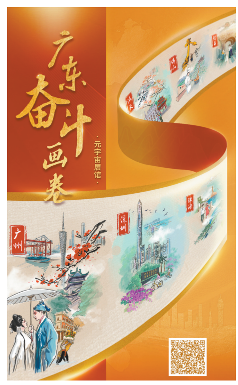
党的二十大大特别报道《广东奋斗画卷·元宇宙展卷》

本版文字：羊城晚报记者 钟传芳 魏礼园 杨廷彦 统筹策划：孙璇 胡泉 执行策划：郑华如 李艳文 周乐瑞 总策划：杜传贵 林海利