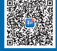
扫码查看羊城派周年庆典专题报道

我们始终向未来而生 迎难而上，一路向前 柒 催生技术革新 我们联袂ZAKER搭建并运营“羊城数藏”数字藏品平台，利用元宇宙虚拟技术打造重大主题宣传创意精品；我们携手荔枝、酷狗音乐、文闻角等羊城创意产业园内的文化科技创新企业，进一步打造科技、文化、服务、媒体深度融合发展的“国字号”智慧媒体文创生态空间； 2月1日，羊城晚报岭南数字创新中心开工，一个具有国际视野、岭南韵味、面向大湾区的文化产业高地正在加速崛起，即将为羊城晚报融媒事业注入更为强劲的平台动力。 …… 扬帆启程，征途漫漫。跨越山海，并肩同行。我们始终心怀对未来的无限向往，从纸开始，向云端深处不懈求索。一起走下去，定将与一切美好如期相遇！