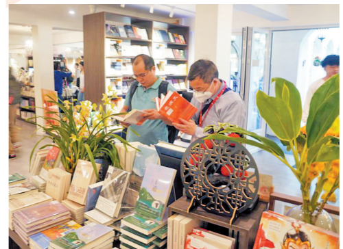
读者在浏览书架上的书籍

陈晓明:ChatGPT确实对文学写作、文学教学都带来了挑战,它通过抓取关键词,能非