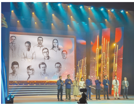
“花城文学之夜”活动现场

3月25日晚,在广州友谊剧院上演的“有凤自南——花城文学之夜暨2023花城文学榜荣誉盛典”,以沉浸式情景歌舞剧晚会的形式,注解着文学的内涵,拓展着文学的外延,让文学变得具体可感,有