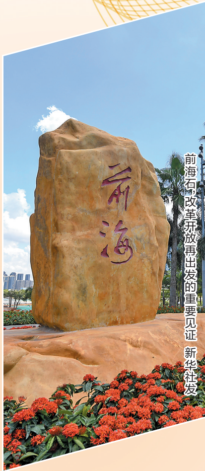
前海开发开放再出发的重要见证 新华社发