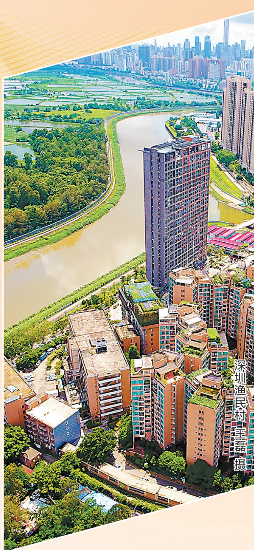
深圳渔民村