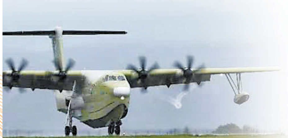
AG600全状态构型灭火机在珠海首飞成功