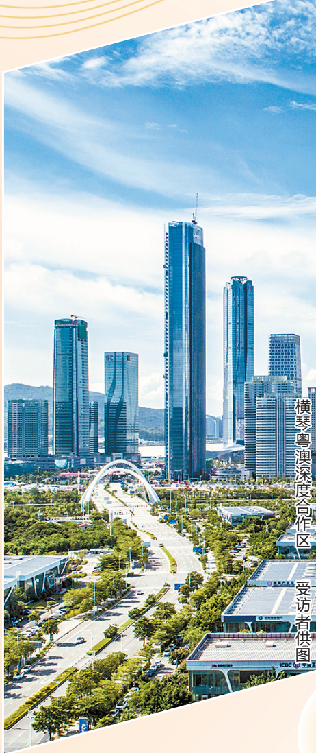
横琴粤澳深度合作区