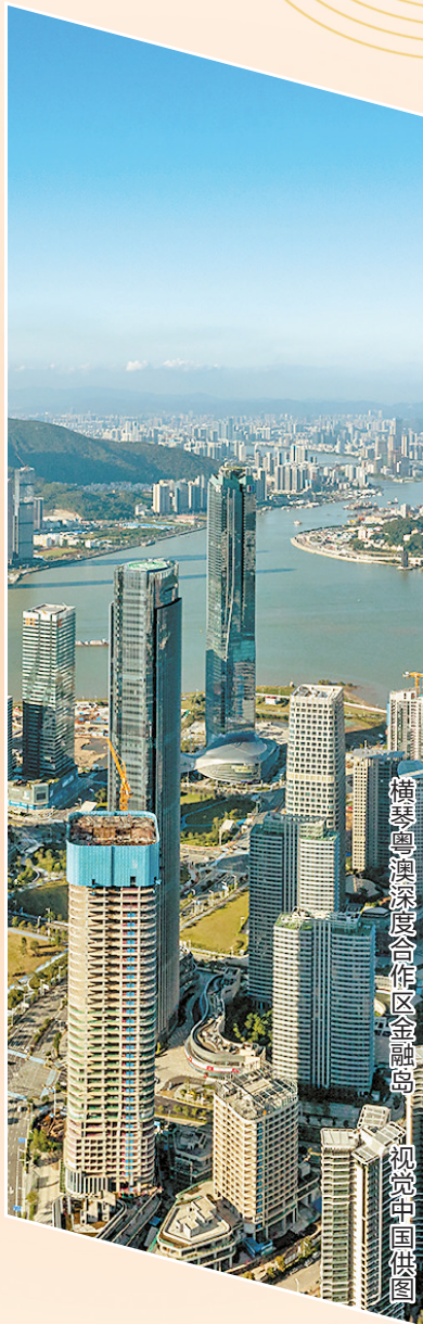
横琴粤澳深度合作区金融岛