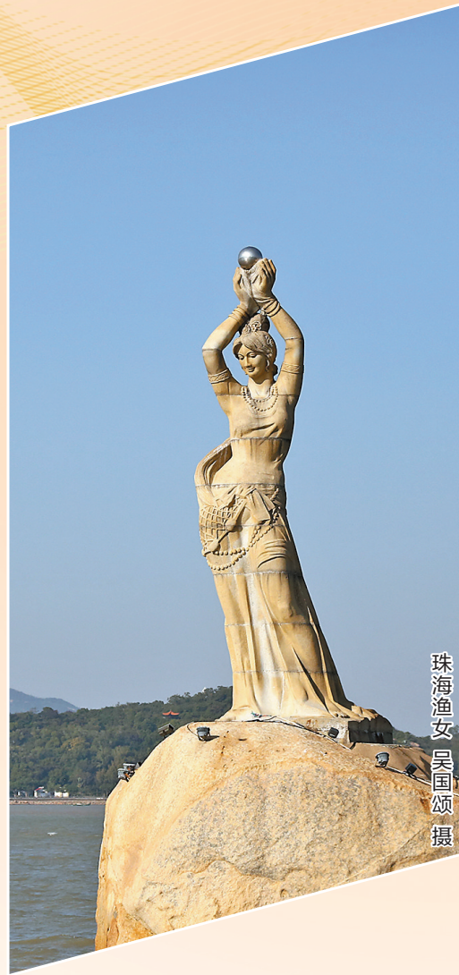
珠海渔女