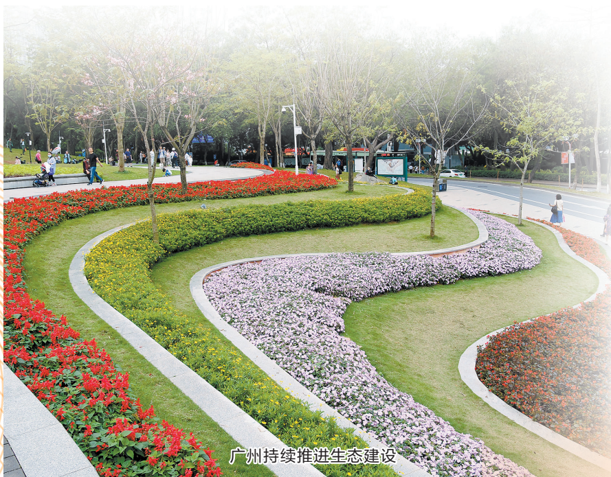
广州持续推进生态建设

以华南国家植物园体系建设为统领，《行动计划》围绕绿化美化和生态建设提出了森林质量优化提升、城乡一体绿美家园优化建设等“八大工程”。新增城乡造林绿化1.65万亩，新建立体绿化4万平方米……到2027年，广州生态公园、城市公园、社区公园、口袋公园等各类公园数量达到1500个以上，公园绿地服务半径覆盖率达到90%以上。