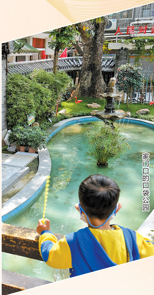
家门口的口袋公园