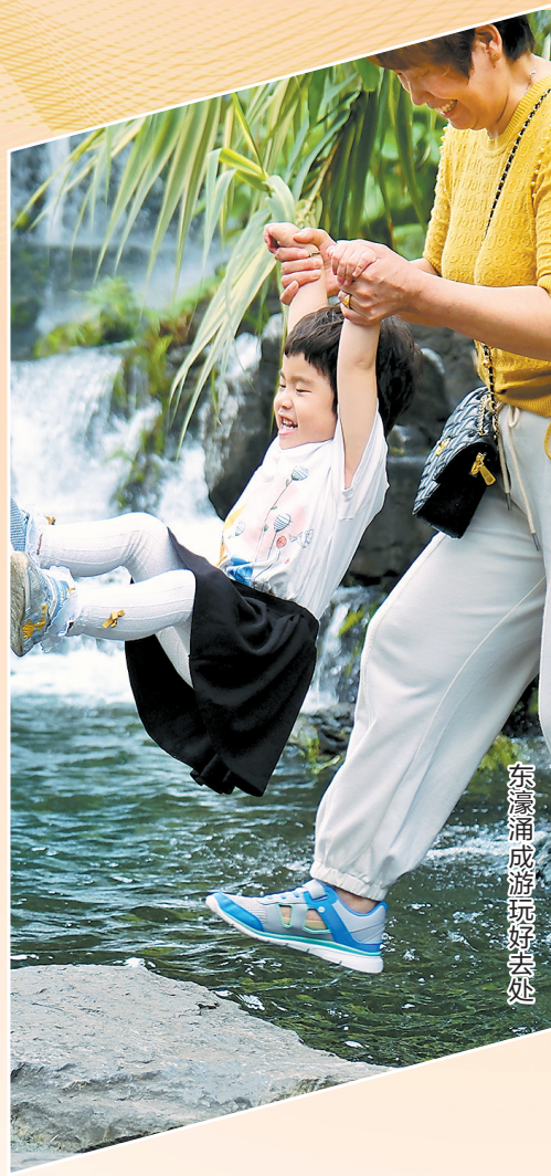
东濠涌成游玩好去处