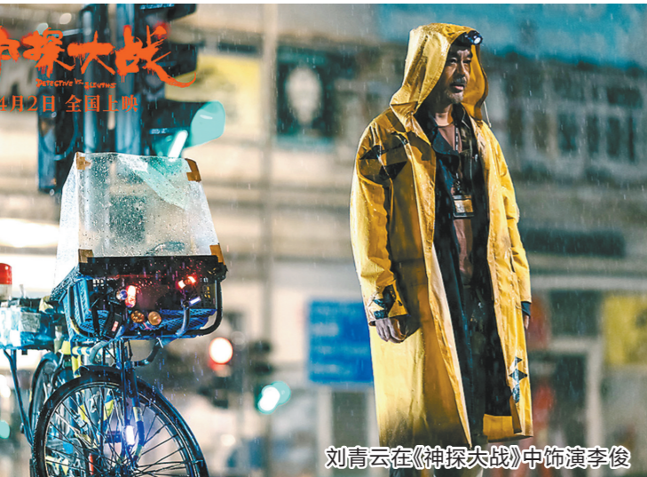
刘青云在《神探大战》中饰演李俊