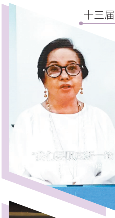
格洛丽亚·马卡帕加尔·阿罗约