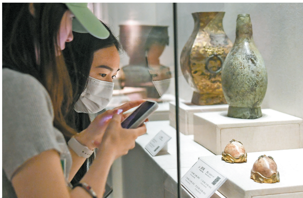
市民游客在深圳博物馆看展