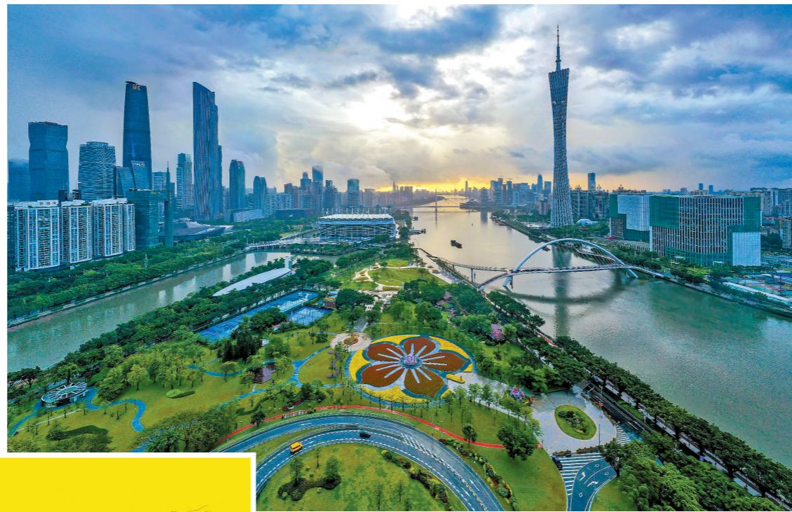
助力广州构建世界级旅游目的地