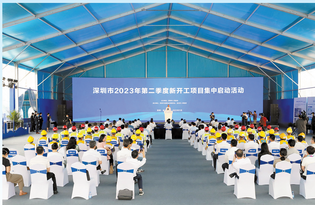
深圳市2023年第二季度新开工项目集中启动活动现场