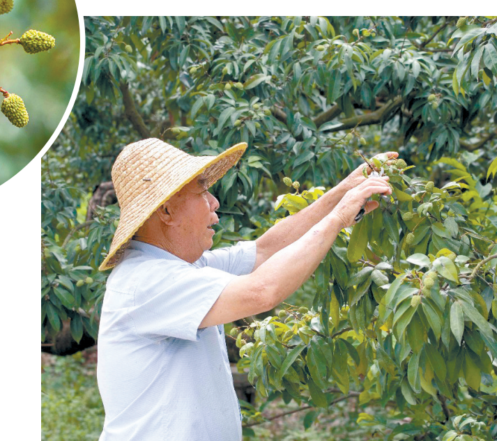
果农正在修剪荔枝树

“本来结果就不多,4月底5月初的时候又因为阴雨天气掉果严重,所以今年荔枝的产量普遍不高。”该农场负责人表示,该镇农业部门多次派出技术人员前来指导,农场也及时采取了相应的保果措施,努力将影响降到最低,“接下来如果天气好的话,今年的产量预计有2万多斤,基本和去年持平。”