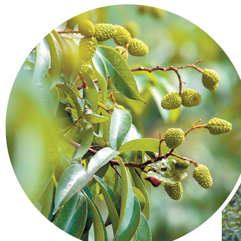
羊城晚报讯 记者王俊伟、通讯员虎门宣摄影报道:东莞虎门荔枝即将上市!

同时,父母对子女的抚养义务不因高额债务而免除,抚养费问题关系到未成年子女能否实际获得稳定的物质保障,因此,法院根据未成年子女的实际需要、被告的实际支付能力和当地的实际生活水平等因素作出按月支付抚养费的判决,符合未成年人利益最大化原则。