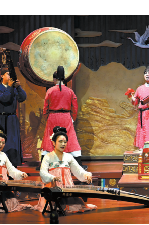
西安大唐芙蓉园内上演的舞台剧《鼓》

西安古城的另一张夜生活魅力名片，就不得不提大唐不夜城。在唐代，这里曾是唐高僧玄奘的译经之处；如今则集文化、艺术、娱乐、体验为一体，从“不倒翁小姐姐”到“李白对诗”，再到如今的“盛唐密盒”，大唐不夜城近年来持续推出的文化类互动节目，一直稳居当地文旅界的“顶流”，已经“掌握了流量的密码”；华灯初上后灯火璀璨、游人如