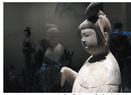
西安博物院展出的女立俑

而位于西安市境内的灞河生态区，自古以来，文人墨客、商旅百姓经此“东出长安”。唐时灞桥设有驿站，人们多在此分手话别，以“柳”谐音通“留”，使“折柳寄情”成为中国人传承千年的独特浪漫。如今的灞河两岸，生态焕新，景色如画。西安世博园、灞桥国家湿地公园等多个大型生态公园绿意盎然。