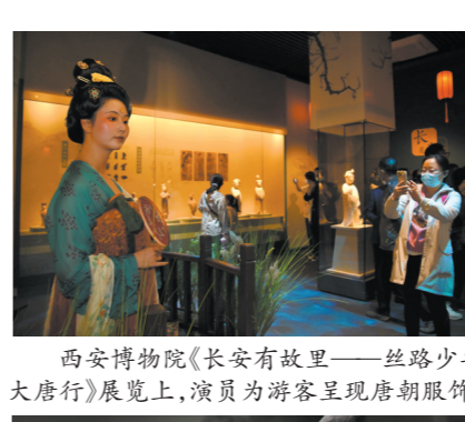
西安博物院《长安有故里——丝路少年大唐行》展览上，演员为游客呈现唐朝服饰

建于唐中宗景龙年间，是为存放唐代高僧义净从天竺带来的佛教经卷、供奉佛舍利而建。小雁塔密檐砖塔的建筑形式，是印度佛塔传入中国长安地区早期的珍贵例证，集中体现了东西方文化交流与融合。现存的唐代建筑小雁塔是西安博物院的重要组成部分，以及文化园林景观构成了独具特色的城市博物馆。这里的唐传长安古乐，是唯一被组合列入该项世界文化遗产的非物质文化遗产。这里也是“丝绸之路”世界文化遗产唯一活态化传承地。