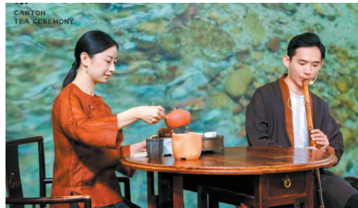
“广州大茶会”展示了广式茶文化内涵

“无由持一碗，寄与爱茶人。”中国是茶的发源地，种茶、饮茶的历史可追溯到四五千年前。广州作为中国茶文化的重要基地，在深度挖掘和开发茶文化资源方面拥有非凡的潜力，借助文旅之翼，广州的茶文化资源正在开启新的篇章，等待更深度的挖掘和利用。