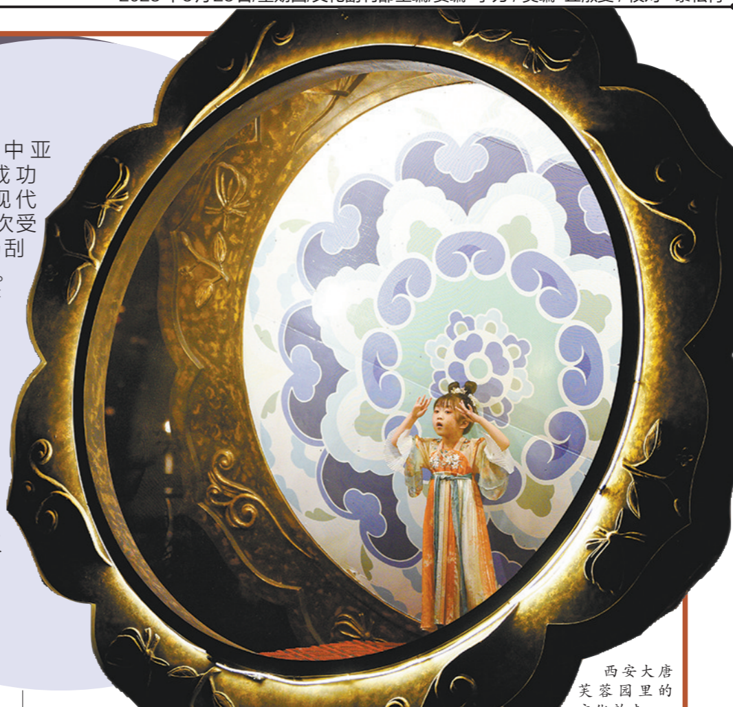
西安大唐芙蓉园里的文化韵味