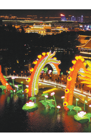
西安大唐芙蓉园2023年“新春大庙会”夜景