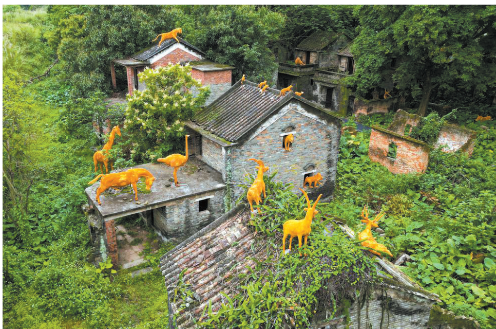
想到这，麦香儿铆足了劲，一路小跑回了村。在村口，爹和娘正等着她呢。爹满面笑容地说：“麦香儿，你刘叔说，过几天就派人来接我到城里看病。”娘也乐开了花：“麦香儿，李阿姨说，她要带娘去医院检查检查，说只要没染病，就让我留下当保姆，让你回来继续读书。” 一家人相拥在一起，喜悦而泣。 郇建安行为艺术作品《豹猫和他的朋友们》

李阿姨对刘叔说：“肺结核是传染病，孩子先留下住几天，我带她去医院检查检查，看她有没有被爹传染，若没有我们就送她回去。还有，肺结核治疗，国家有免费政策，你们工作队可去县疾控中心联系一下。” 就这样，麦香儿在刘叔家住了几天。这不，现在她已做完检查，正按刘叔安排，回纪家岩村的家里呢。刘叔说，要让她回去读书，还帮她爹联系好了免费治病的地方。 麦香儿在小溪边捧水喝的那一刻，看到了自己的身影，她也惊讶了，水里那个影子真的不是去时的那个麦香儿了。她原来那身衣服早被李阿姨换掉了，是刘叔的主意，他们给麦香儿换了一身新衣服，又带她去找县医院放射科的王主任拍了张胸片。王主任看完片子说：“放心吧，这孩子健康着呢。” 看着山路边上开的那些叫不出名儿的花，麦香儿笑着摘了一朵白色的小花，放在鼻子边轻轻闻了闻，她又想起李阿姨身上常常飘出的那种淡淡的香味。她想，李阿姨真好！就像这花儿一样好美、好香。