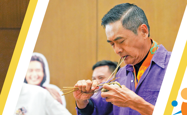
包粽、扎粽,发哥手法娴熟