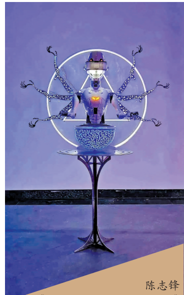
陈志锋《what is,what if, what next》

在作品呈现上,此届毕业展更加注重作品的艺术展示效果和观展体验。为此,广美雕塑与公共艺术学院对展馆进行全面提升,加强了物理空间的展示性,在策展环节更加强调作品与空间共同构成的场域营造,打造了具有深刻语境内涵、沉浸式艺术体验的视听感知空间。