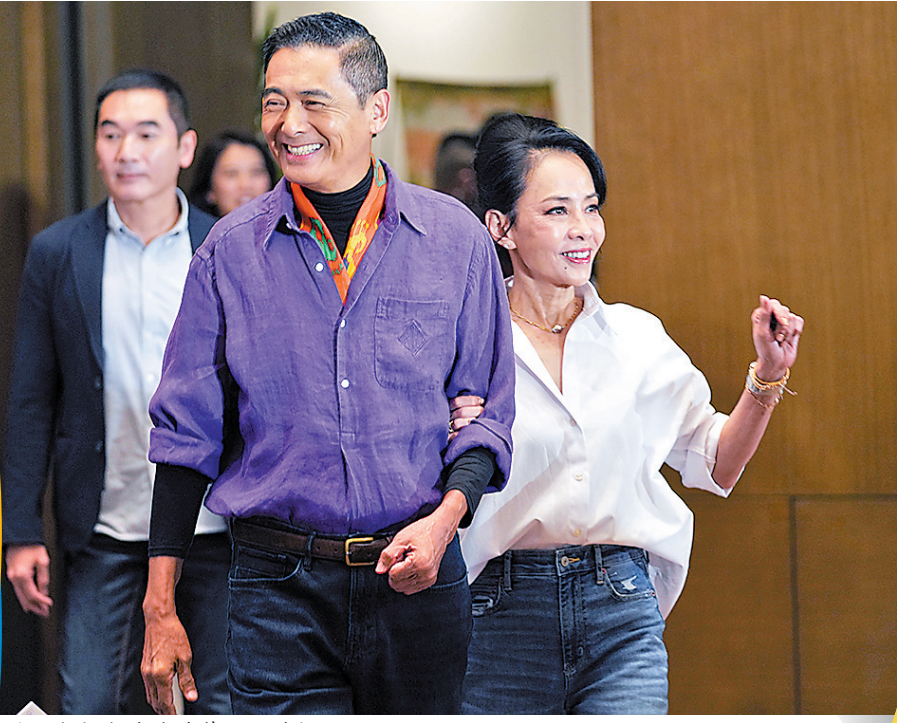
周润发与发嫂陈荟莲一同登场