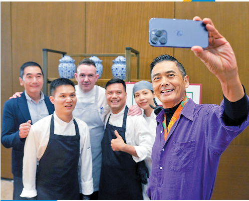
“自拍狂人”发哥上线

周润发此前已经带着《别叫我“赌神”》前往上海和北京,热爱跑步的他在上海外滩晨跑、在北京参加父亲节亲子跑;但来到广州,画风就不一样了!在当天下午的媒体发布会上,“发记士多”开张,周润发变成“厨神”,现场包粽子、煮公仔面、做菠萝油,还特地做了一道承载他童年回忆的特别甜品——白糖水煮面包皮。发哥不仅热爱平民美食,而且煮起菜来手脚麻利,一看就是常干活的人!