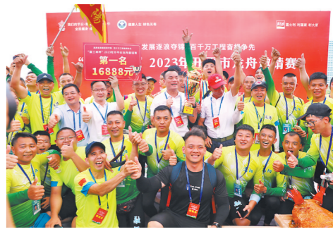
勇夺锦标喜返颜开