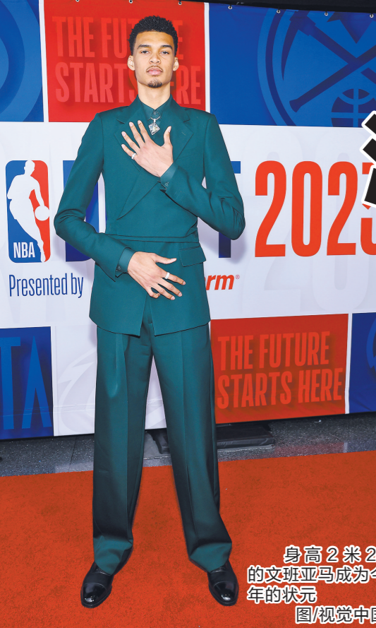
身高2米24的文班亚马成为今年的状元

文班亚马的到来，不能一劳永逸地解决马刺的问题，这支上赛季排名联盟倒数的球队还需要在文班亚马身边囤积更多的才能，再经过数年磨合，才可以让球队重回豪强行列。现阶段马刺阵中尚有控卫的“天坑”需要弥补，球队在选中文班亚马后，也将围绕他的成长进行一系列长期团队建设。