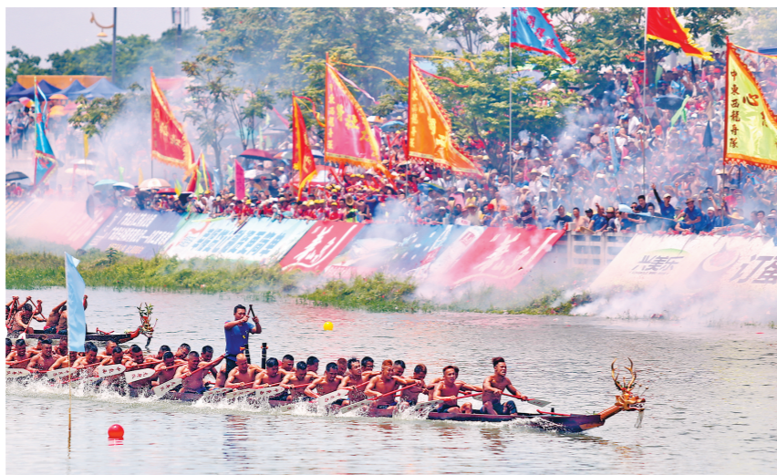
“三夹腾龙”拔头筹、争上游

今年，鹤山市把龙舟文化季的活动主题定为“龙腾三夹 鹤舞昆仑”，旨在“三夹腾龙”非遗名片的引领下，以龙舟文化为内核，在鹤山城乡加快发展的进程中，涵养龙舟文化，弘扬龙舟精神，推动鹤山高质量发展始终不居人后、一往无前，努力拔头筹、争上游，争当广东县域高质量发展排头兵。