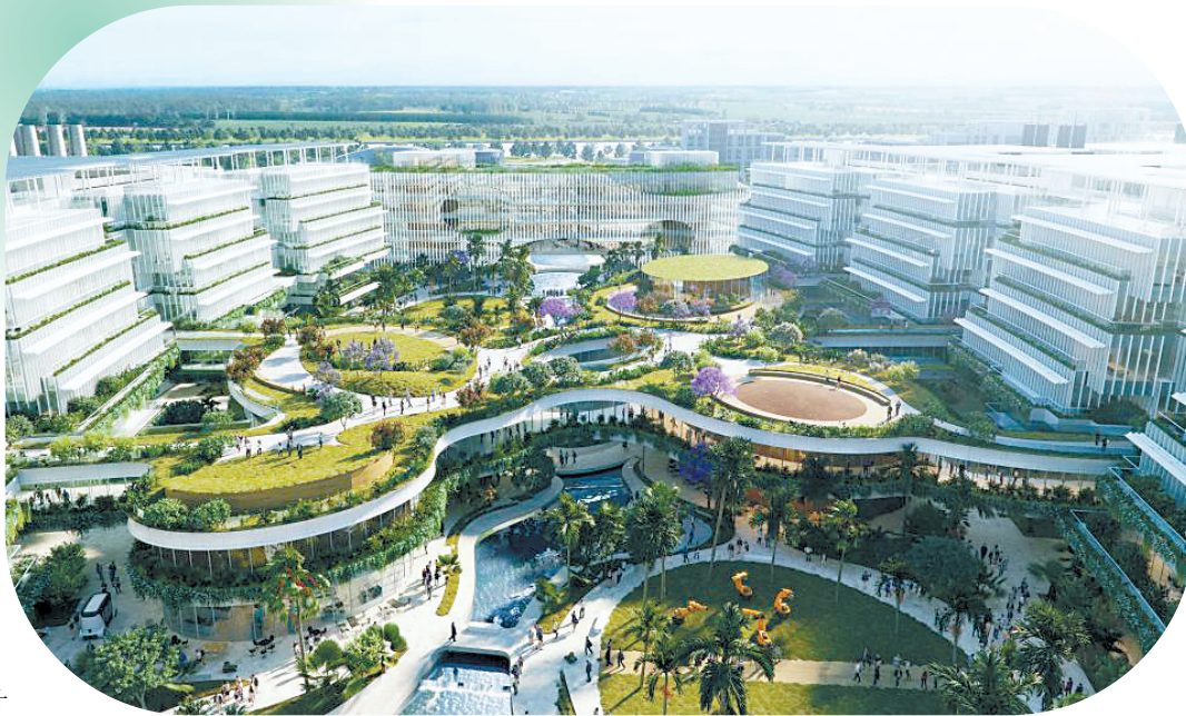
香港科技大学(广州)校园鸟瞰图

由此可见,多所高校正乘着教育部大力支持中外合作办学的利好政策,逐步实现本校中外合作办学项目或机构“零”的突破。这不仅有利于国内高校在优秀理念“引进来”与人才培养“走出去”中实现自我发展,也为多数填报高考志愿的学生与家长提供更多新的选择。