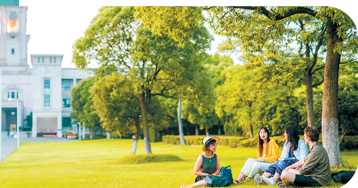
宁波诺丁汉大学校园

部分中外合作办学要求学生的英语单科达到一定成绩才能填报志愿,如宁波诺丁汉大学要求学生的英语单科成绩(满分150分)不低于115分,若报英语专业,高考英语单科成绩原则上不低于120分;上海纽约大学要求学生提交多邻国、托福、雅思等英语成绩作为申请材料;温州肯恩大学要求普通类专业考生英语单科成绩(满分150分)须达到110分及以上,如符合英语单科成绩要求的生源不足,可酌情降低英语成绩要求,最高降分不超过10分;美术类专业考生英语单科成绩(满分150分)须达到95分及以上。