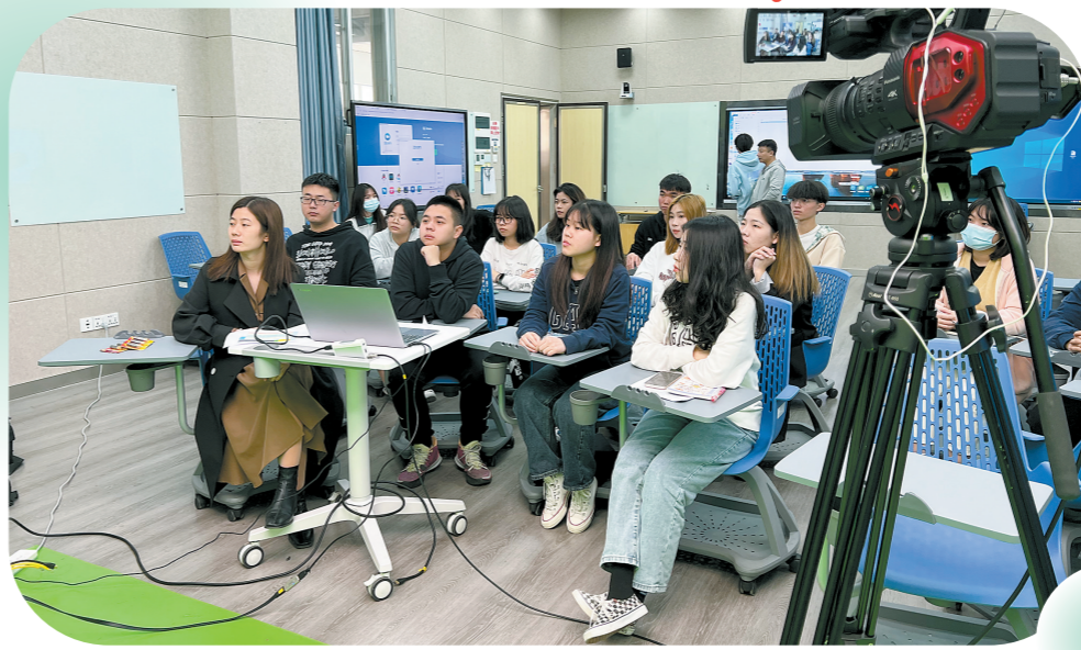
番禺院工程造价专业学生正在上网课 羊城晚报资料图