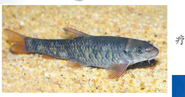
温泉池里享受“鱼疗”一度非常受欢迎