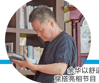
余华以舒适穿搭亮相节目

1988年，莫言和余华进入鲁迅文学院和北京师范大学联合举办的创作研究生班学习，两人成了同学兼室友。在“山海经”书屋，两人再次相见，追忆当年。颜小可透露，莫言到的那天，余华正巧拿着一本《等待戈多》，两人在一棵茂密的大树下相遇，这与《等待戈多》第一幕十分相似。余华便对莫言说：“我们就像‘等待戈多’一样等待你。”