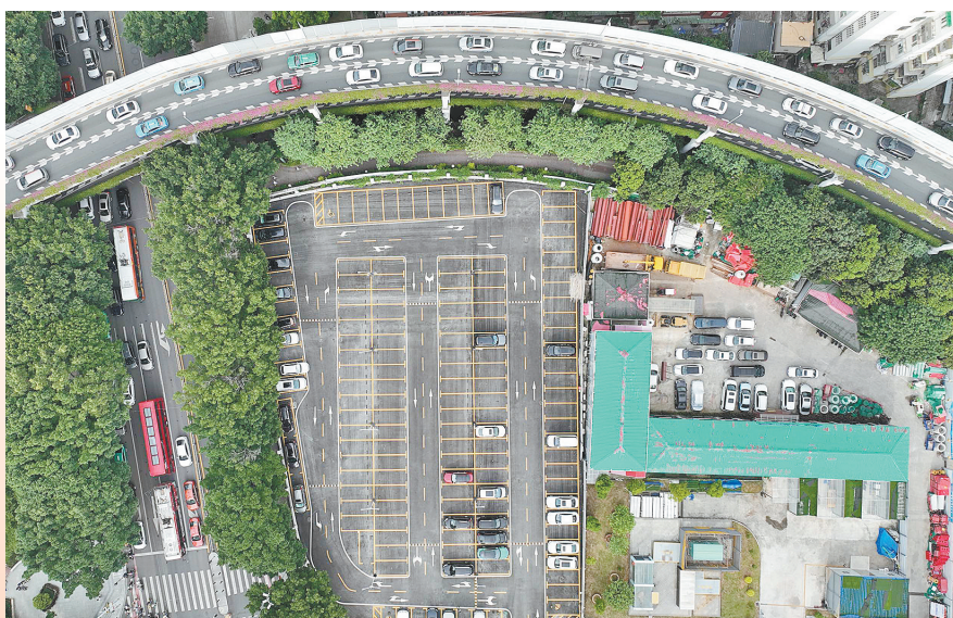
闲置地块被开辟成智慧停车场，解决了居民“停车难”问题