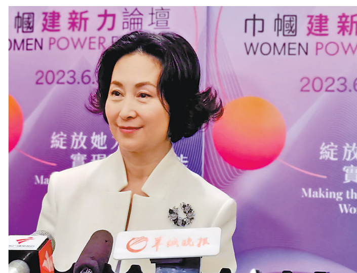
何超琼接受媒体采访