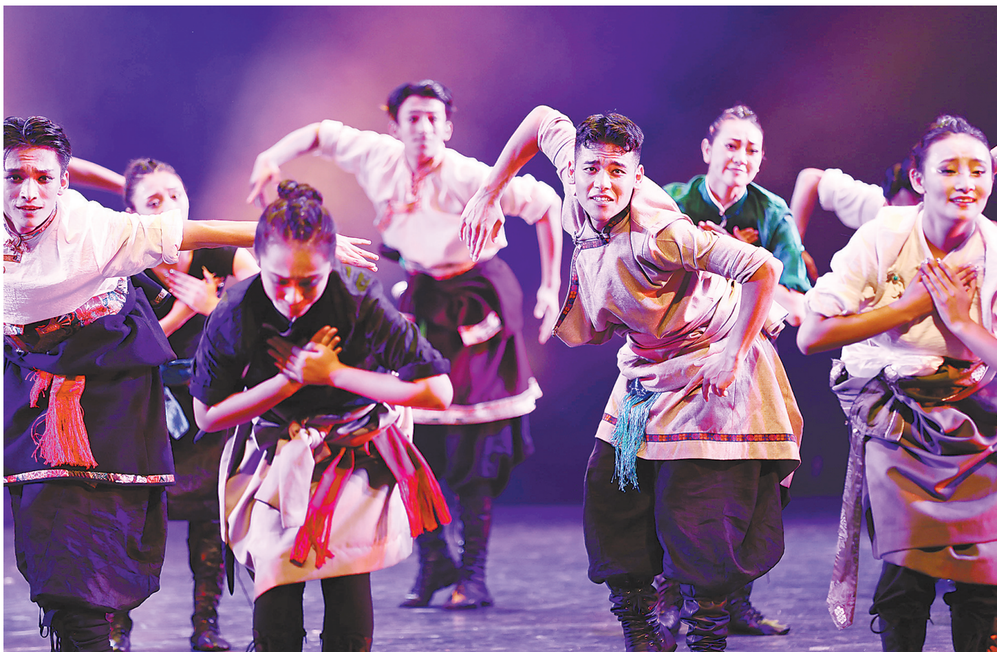
2023年7月5日晚，林芝班成员进行汇报演出

当日，中英贸易“破冰之旅”70周年活动由中国国际贸易促进委员会与英国48家集团俱乐部、英中贸易协会共同在京举办。