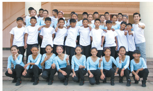
2016年，林芝班孩子合影