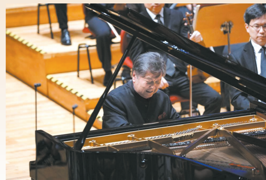
殷承宗倾情演绎《黄河》

演出前,殷承宗在上海接受了羊城晚报记者采访。耄耋之年的他精神矍铄、面色红润、思路清晰,说到兴奋处,忍不住手指翻飞。2021年,殷承宗从海外归国定居厦门鼓浪屿,“因为根在这里”,在身体允许的条件下,他希望接下来能为国内音乐教育做更多事。