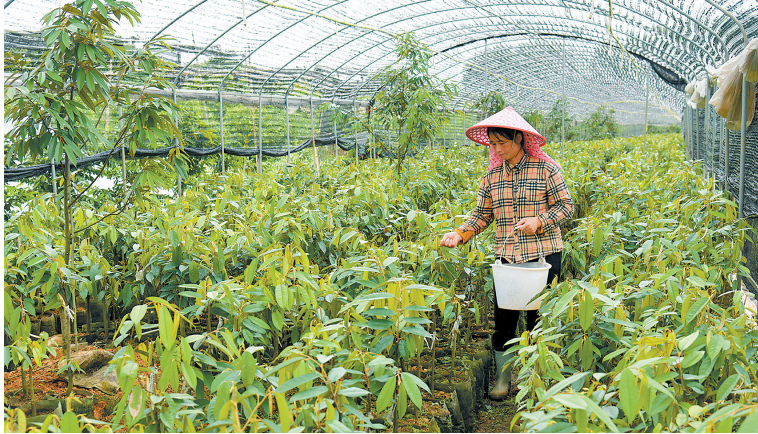
位于茂名电白的榴莲种植基地内，管理员给榴莲果苗施肥

南盛街道不仅有满目清爽的“阳光玫瑰”，也有另一片火红的风景——1700多亩火龙果迎来丰收季节，工作人员正在采摘，忙得不亦乐乎。由于是本地种植，火龙果甜度高、口感好，不仅在这里“落地生根”，还帮助解决了周边村民的就业问题。