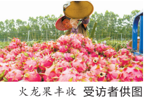
火龙果丰收

事实上，火龙果源于种植技术，曾高度依赖进口，从价格较高昂到成为平价水果，缘于国产火龙果种植规模的不断扩大。相关报告显示，十多年来，国内火龙果种植面积和产量从平缓增长到迅速扩张，我国成为全球火龙果第一大国。