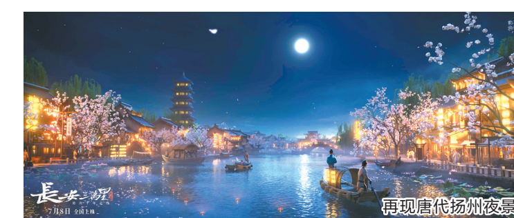
再现唐代扬州夜景

谢君伟:这部片子很有意思的一点是,这些诗词就是这些诗人的人生,是他们走过唐代的大江南北,看到那些景色之后的有感而发。比如李白,他走过繁华的长安、温柔的扬州、辽阔的塞北,这些地方我们都在片中一一呈现。因此,我们的视觉风格可