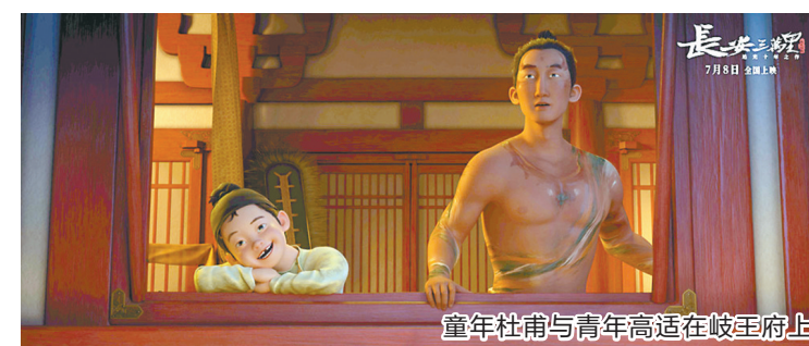
童年杜甫与青年高适在岐王府上

宋依依:我觉得不是中年人才能看懂,而是每个年龄层的观众看到的东西都不一样。对小朋友来说,这段历史可能在他们心里埋下了种子,未来他