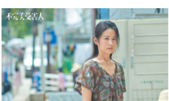
颖儿通过《不完美好受害人》尝试转型