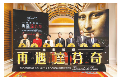
“光影如炬：再遇达芬奇”艺术特展现场

7月30日，“光影如炬：再遇达芬奇”艺术特展在澳门永利皇宫正式开展。作为澳门大型国际文化艺术盛会“艺荟澳门：澳门国际艺术双年展2023”的重要组成部分，“光影如炬：再遇达芬奇”透过精心设计的全息影像、光影投射及虚拟现实等先进技术的应用，提供了极具震撼力的360度全方位沉浸式观展体验。