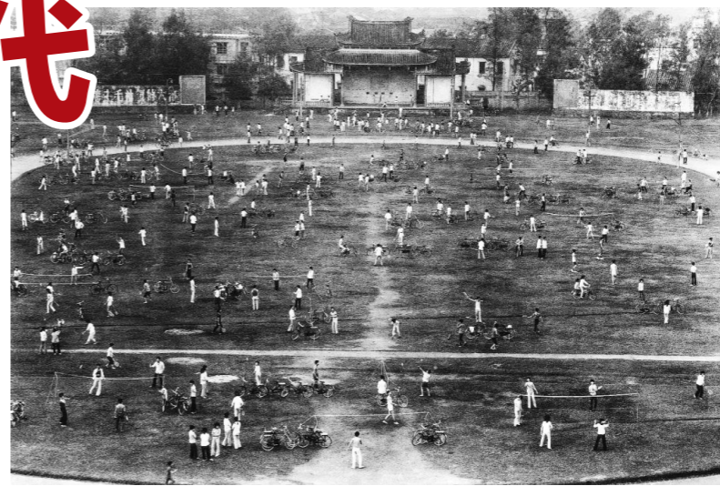
广东省揭阳县城晨间打羽毛球的人们，1965年

日前，在羊城晚报艺术研究院展出的“观复·安哥摄影作品收藏展”让他“重出江湖”，多年来的34幅摄影作品重回公众视野。在他“或有趣味、或矛盾、或深刻”的镜头捕捉下，改革开放以来的老城记忆、市民生活引发观者的阵阵共鸣。展览将持续至8月16日。