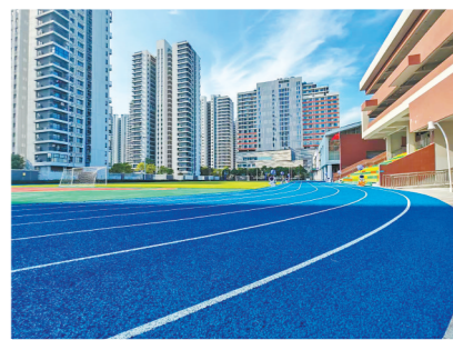
南沙梅沙实验小学为学子提供齐全完备的硬件基础和强有力的空间保障

广东证监局表示,将认真落实证监会高质量建设北交所有关工作部署,加强与工信、金融等部门协作,支持专精特新企业利用北交所实现高质量发展,按照“重点地市逐城推动、重点企业逐家引导”的思路,引导推动珠三角各地市符合条件的企业紧抓北交所上市机遇。