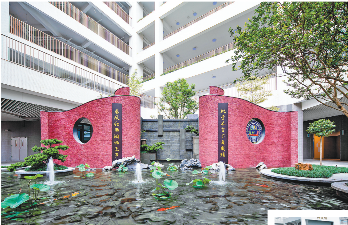
▲黄埔区铁铮学校传承广铁一中办学理念,高标准培养学子

2023年堪称近年来广州小学一年级入学需求“最火爆”的一年,“全面二孩”政策下出生的孩童进入到义务教育阶段,引起入学高峰。广州市教育局数据显示,今年广州小学入读报名人数近26万人,同比增加约4.6万人。作为标杆房企,今年,包括广州市黄埔区铁铮学校(西校区)、增城区华南师范大学附属新塘实验小学、南沙区梅沙实验小学在内,万科在广州交付了三所优质公办小学,积极引入名校集团办学,它们的高品质交付及顺利开学,为推动全市教育发展提供了强有力的支撑。