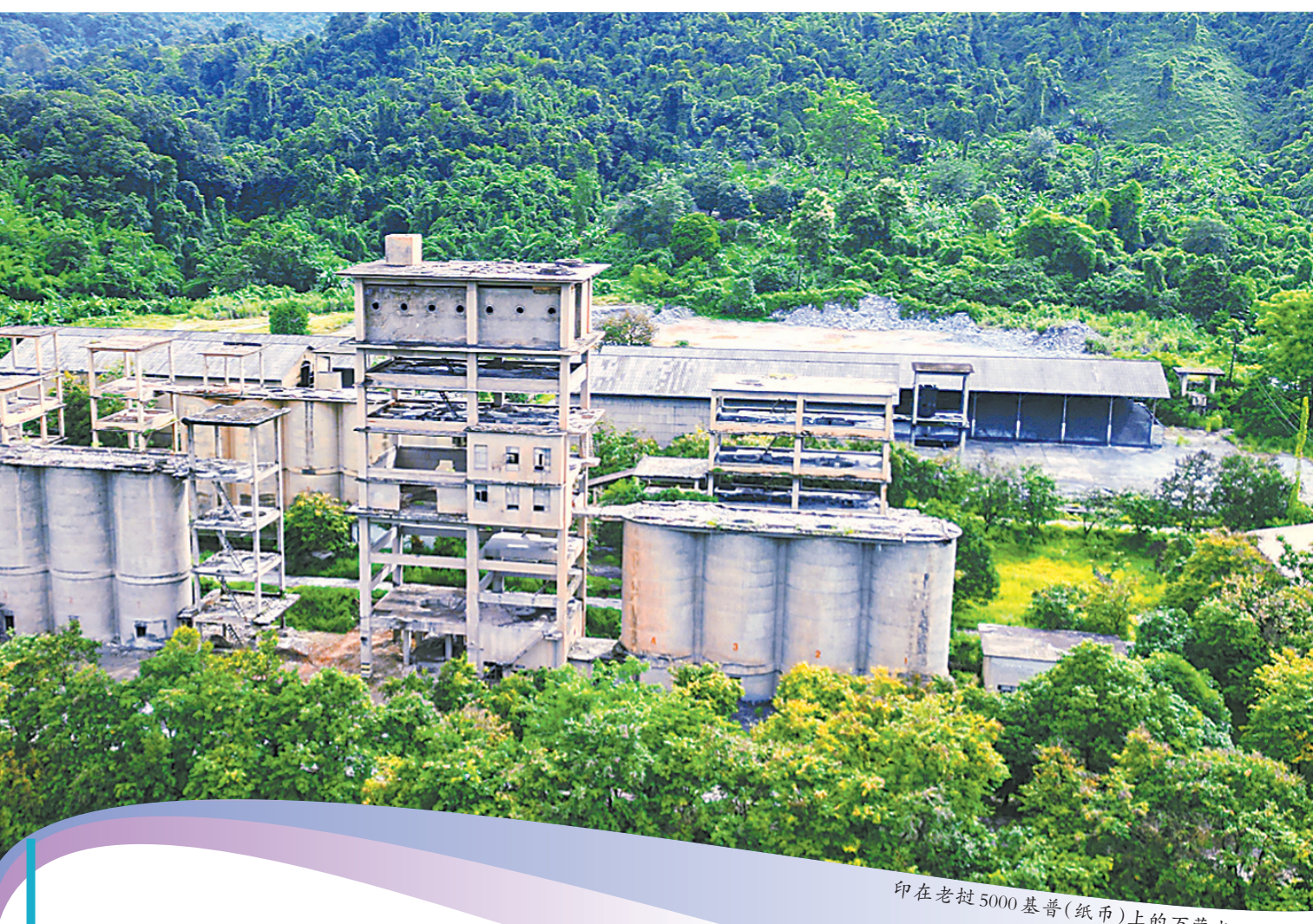
印在老挝5000基普(纸币)上的万荣水泥一厂