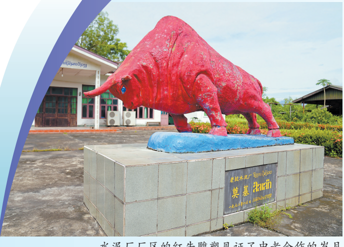
水泥厂厂区的红牛雕塑见证了中老合作的岁月

基普是老挝的法定货币，目前老挝国内主要流通面值500基普、1000基普、2000基普、5000基普、10000基普、20000基普、50000基普、100000基普的纸币。其中5000基普为1997年发行，正面印有老挝领导人凯山·丰威汉，背面印有万荣水泥一厂全貌，是当时面值最大的老挝货币，大概相当于当时的人民币33元。万荣水泥一厂是由中方帮助建设、中老共同管理的老挝首家水泥厂，结束了老挝不能自主生产水泥的历史，为老挝经济社会发展作出了重大贡献，是中老合作的重要标志。