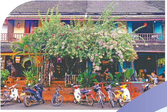
◀中老铁路国际旅客列车开通后，老挝古城琅勃拉邦迎来越来越多的中国游客