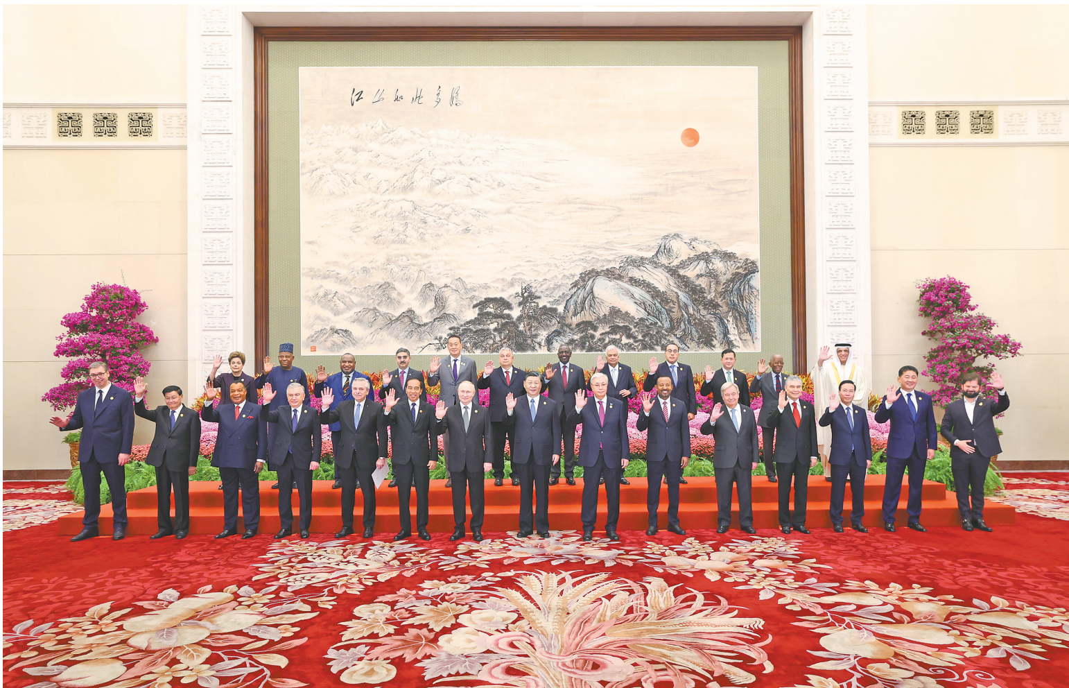
会前，习近平同出席高峰论坛的外国国家元首、政府首脑和国际组织负责人等国际贵宾集体合影

新华社电 10月18日上午，国家主席习近平在人民大会堂出席第三届“一带一路”国际合作高峰论坛开幕式并发表题为《建设开放包容、互联互通、共同发展的世界》的主旨演讲。习近平宣布中国支持高质量共建“一带一路”的八项行动，强调中方愿同各方深化“一带一路”合作伙伴关系，推动共建“一带一路”进入高质量发展的新阶段，为实现世界各国的现代化作出不懈努力。 金秋时节，天高气爽，风清日朗。天安门广场上，共建“一带一路”国家国旗迎风飘扬，相映成辉。 出席高峰论坛的外国国家元首、政府首脑和国际组织负责