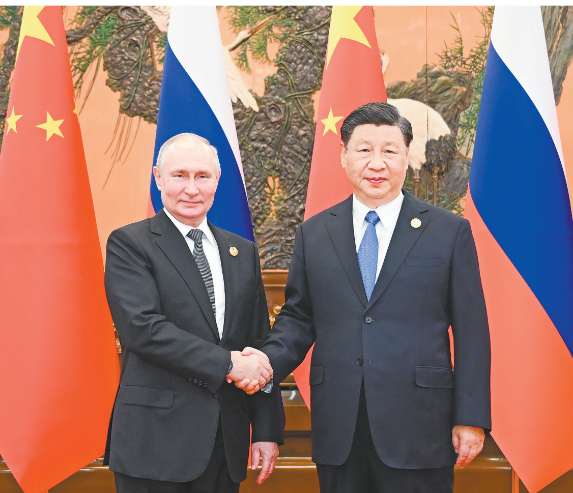
10月18日中午，国家主席习近平在北京人民大会堂同来华出席第三届“一带一路”国际合作高峰论坛的俄罗斯总统普京举行会谈

新华社电 10月18日中午，国家主席习近平在人民大会堂同来华出席第三届“一带一路”国际合作高峰论坛的俄罗斯总统普京举行会谈。 习近平指出，普京总统连续3次出席“一带一路”国际合作高峰论坛，体现了俄方对共建“一带一路”倡议的支持。俄罗斯是中国开展共建“一带一路”国际合作的重要伙伴。中俄东线天然气管道等重大基础设施项目投入运营，为两国人民带来了实实在在的益处。中方愿同俄方及欧亚经济联盟各国一道，推动共建“一带一路”与欧亚经济联盟对接，开展更高水平、更深层次的区域合作，希望中蒙俄天然气管道项目尽早取得实质性进展，开展好“万里茶道”跨境旅游合作，把中蒙俄经济走廊打造成一条高质量联通发展之路。 习近平强调，发展永睦邻友好、全面战略协作、互利合作共赢的中俄关系不是权宜之策，而是长久之计。明年是中俄建交75周年。中方愿同俄方一道，准确把握历史大势，立足两国人民根本利益，不断充实双方合作的时代内涵。中方支持俄罗斯人民走自主选择的民族复兴道路，维护国家主权、安全、发展利益。双方要推动中俄务实合作高质量发展，积极开拓战略性新兴产业合作，以2024—2025年中俄文化年为契机，举办更多丰富多彩的文化交流活动。（下转A2）