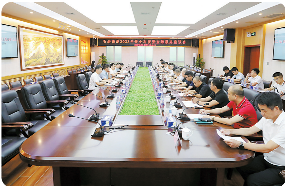
石岩街道2023年银企对接暨金融服务座谈会现场

今年前三季度,石岩街道还引进了中建三局、华诚智能、华初科技、太极疆泰等34家企业;重大工业项目任达科技园升级改造主体施工进度达85%,特种设备安全检测基地已建成投产,创维“5G+8K”产学研中心完成验收。是什么让制造业企业对石岩街道如此青睐?不难看出,是街道和企业同频、切实服务企业的理念和行动,让制造业企业在石岩绽放魅力。