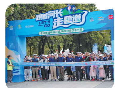
市民准备出发走碧道

东莞已形成了一批各具特色的碧道,碧道成为越来越多市民漫步休闲、健康运动、亲水游玩的好去处。东莞碧道不仅仅独美其身,更是一条长长的文化纽带,串联起所经之处的文化资源,形成一道道亮丽的风景线。东莞通过碧道建设与地域文化融合发展,带动了周边商业、文化旅游的发展,充分挖掘碧道建设的生态效益和文化价值,碧道正成为城市文化的新名片、新亮点。