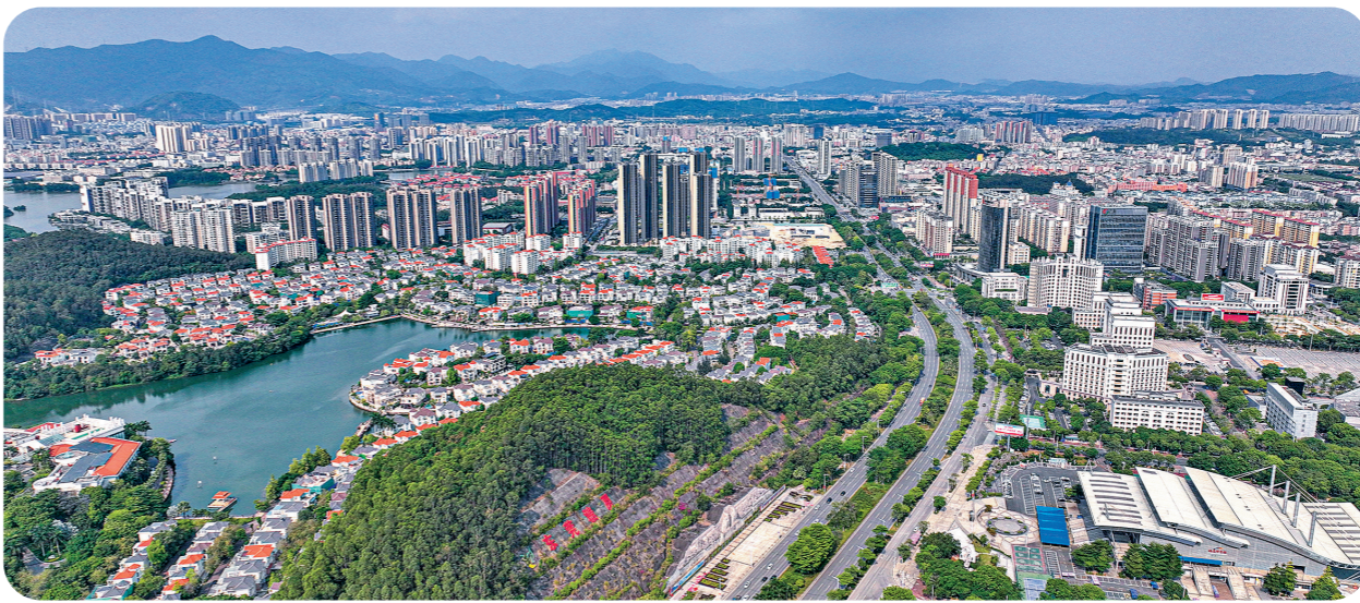
塘厦镇城市品质进一步提档升级

站在新起点,塘厦抓住“百万工程”良好机遇,在更深层次把发展潜力和动能全面释放出来,并以创建广东省文明镇为抓手,进一步推动城市品质提档升级。