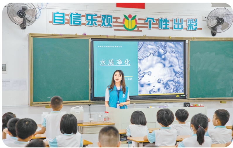
环境科普进校园活动

十年扬帆,勇立潮头,在东莞市水务集团深入推动“水务一体化”发展战略的新征程上,东莞净水公司紧密围绕东莞市水务集团持续做强做优做大水质净化板块的重要战略部署,勇担国企责任和使命,为绘就人水和谐新画卷增添净水底色,共同守护莞邑一湾碧水。