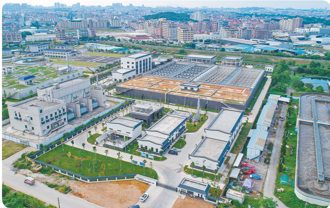
寮步竹园污水处理厂三期扩建工程

维护健康水生态、保障国家水安全,是关系国计民生的大事。近年来,东莞市水务集团净水有限公司(以下简称“东莞净水公司”)坚守东莞市水务集团有限公司(以下简称“东莞市水务集团”)“以水至善,以善至美”的企业使命,以披荆斩棘的奋斗者姿态,在水质净化业务板块精耕细作,致力于打造成为东莞本土污水处理核心平台,为东莞打好打赢水污染防治攻坚战贡献必不可少力量,用实际行动扛起了新时代环境保护的国企责任和使命。