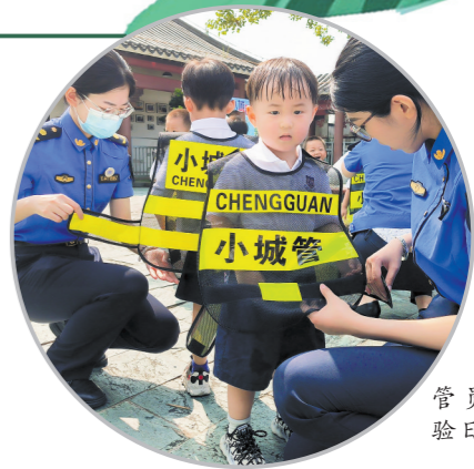
“小小城管员职业体验日”活动