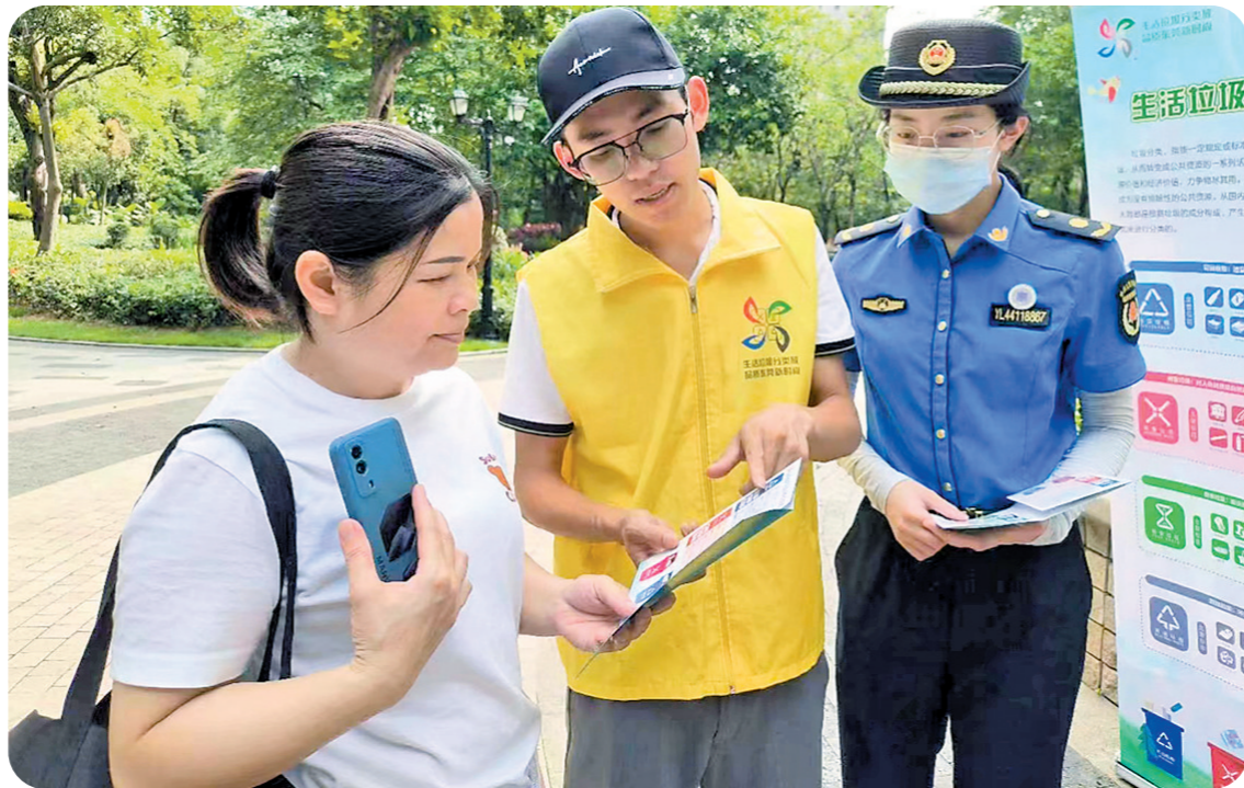
垃圾分类进社区宣传活动

生活垃圾分类工作是民生“关键小事”。早在2021年, 松山湖已取得“生活垃圾分类示范园区”的称号。2023年以来, 松山湖城管分局持续发力不放松, 利用已打造的生活垃圾示范点、街道、居民区的示范效应, 加强对松山湖高新区生活垃圾分类管理, 提高轻量化、资源化、无害化水平, 打造优良居住环境和生态环境, 进一步提高松山湖园区生活垃圾分类示范片区建设水平, 实现园区所有区域生活垃圾分类全覆盖。