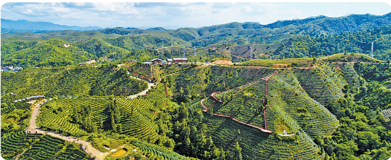
紫金茶产业已成为富民兴村的特色产业、支柱产业

今年以来,紫金县贯彻落实省委“1310”具体部署,构建完善“1369”工作体系,全面推进“百千万工程”在紫金落地见效,实现县域动能澎湃,城乡提质增效。