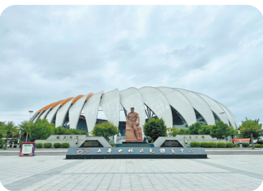
五华奥林匹克体育中心

丰富的文化内涵是五华独特优势资源所在,其独特的历史文化、足球文化、红色文化、非遗文化、诗词文化、美食文化等等,交相辉映,经典璀璨。在此过程中,五华县坚持政府引导、群众主体、社会参与,大力推进群众文化活动建设,取得了显著成效。