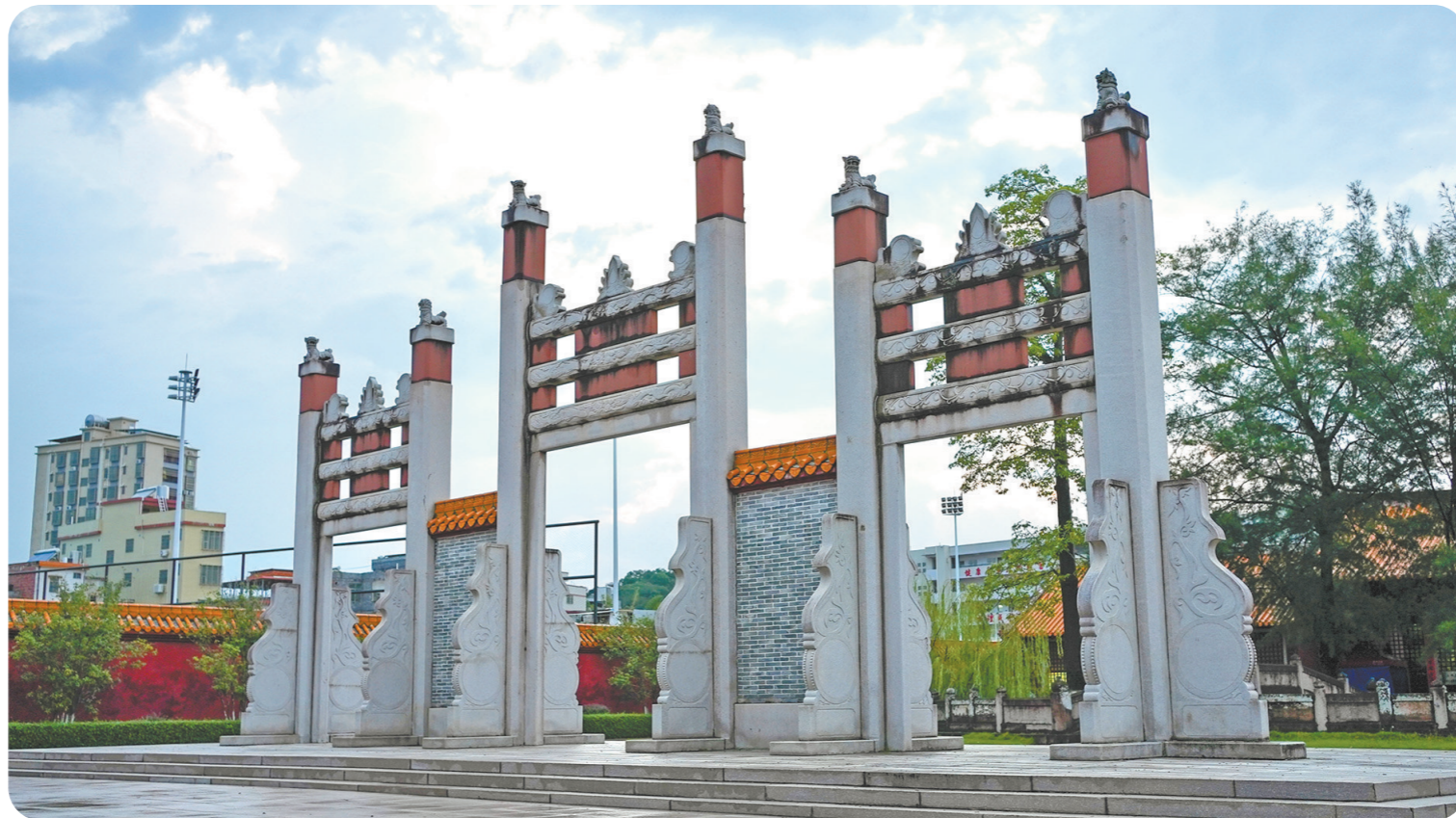
具有550多年历史的长乐学宫内一景

把握新机遇,奋进新征程。五华县认真落实中央和省、市的决策部署。坚定文化自信,用“文化力量”推动发展繁荣,以“文化动能”提升城市形象,全力推进苏区融湾先行区建设,深入实施“百千万工程”,努力走出一条新时代老区苏区振兴发展新路。