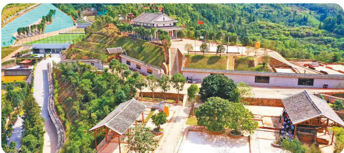
梅州五华·元坑遗址景区

一直以来,五华县委、县政府高度重视文化事业的繁荣和文化产业的发展,依托丰富厚重的历史文化优势,整合资源,赓续薪火传承发展,营造文化产业良好环境,通过文化和旅游融合、文化与科技融合、文化创意产业集聚,推动文旅融合高质量发展。