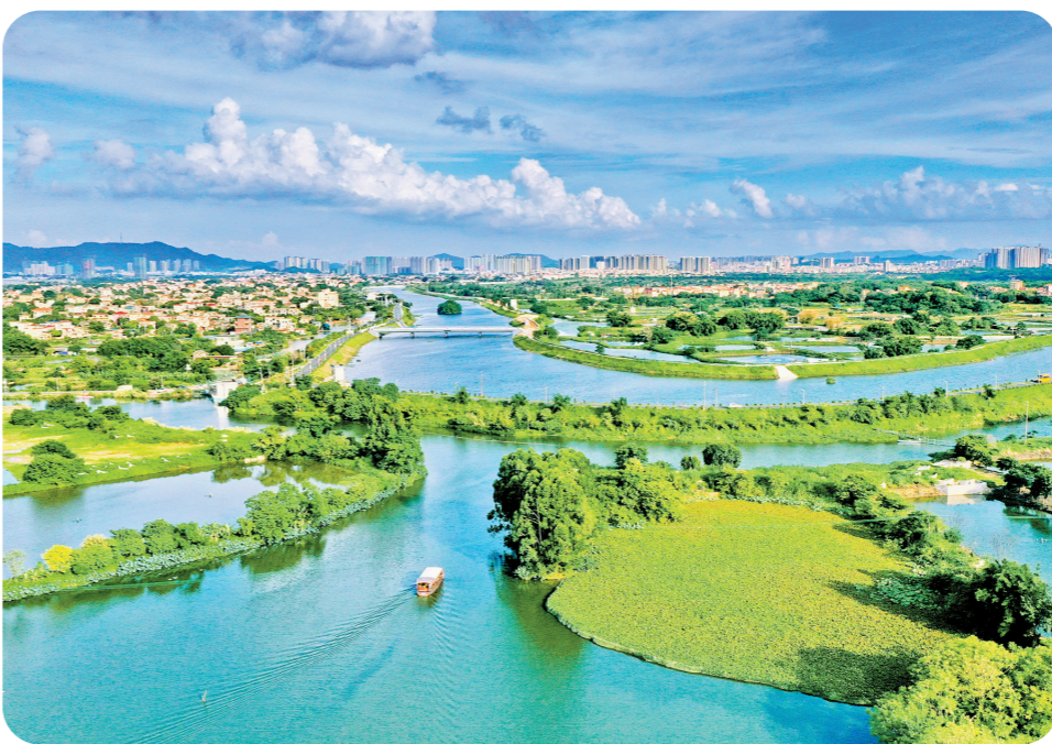
江门全力推动城乡区域协调发展走在前列

为畅通城乡双向流通,服务城乡经济社会融合发展,方案提出加强交通运输设施建设,推进重大交通项目谋划建设,以及衔接高速公路的农村公路“四升三”项目、建制村通四级双车道道路改造等工程;加快城乡供水设施建设,结合农村供水“三同五化”改造提升工作,推动实现县域供水一体化和农村供水规模化;加快能源基础设施建设,重点规划建设新会新能源汽车“双碳”产业园、台山广海湾能源“双碳”产业园,打造区域绿色低碳现代能源保障基地。