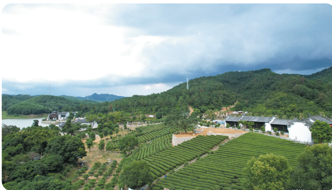
共和镇朱苏山水人家

自“百千万工程”实施以来,江门鹤山加快推进城乡融合发展,以产业转型升级促城市提质扩容、镇村环境提档升级。随着一个个惠民生项目落地见效,市民群众的生活越来越好。