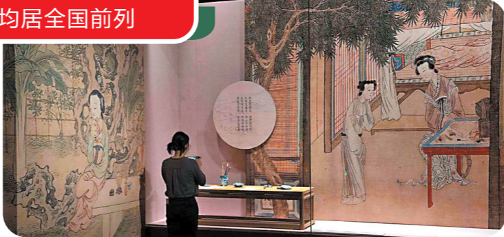
观众打卡广东省博物馆《西厢记》文化展

近年来，广东扎实推进文化强省建设，在交出物质文明和精神文明两份好的答卷上努力取得新突破。在博物馆与观众“双向奔赴”的背后，是广东全省博