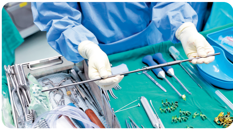
通过“港澳药械通”政策，“磁力可控延长钛棒”在港大湾区应用