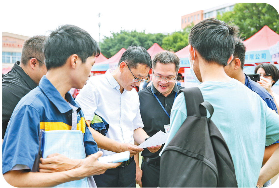
广州市机电技师学院今年校园招聘会场火爆

这些靓丽的成绩单,是学院高水平教育教学质量的生动体现。近年来,学院始终把党的领导贯穿办学全过程,牢牢把握粤港澳大湾区建设的历史机遇,紧紧围绕高质量发展的工作主线,为广东技能人才发展注入澎湃动力,为粤港澳大湾区高质量发展源源不断地输送应用型、复合型、创新型高素质技术技能人才。