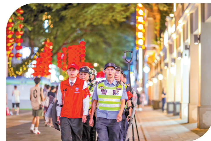
民警和最小应急单元队员联合在广州街头开展巡逻

“未来,人工智能是否能应用到警务工作中?无人巡逻是否能实现?”广州市公安局相关负责人告诉记者,广州社会治安防控体系建设还会不断迭代升级、优化。“没有最快、最好,只有更快、更好。”