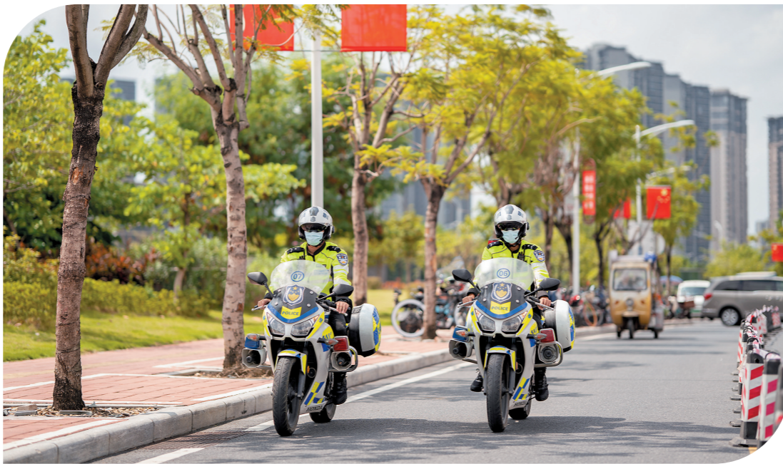
交警铁骑在广州街头巡逻

数据显示,今年以来,截至目前,全市刑事、治安警情已下降约13%,广州市民安全感连续10年保持在95%以上。