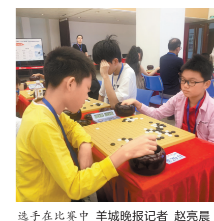
选手在比赛中