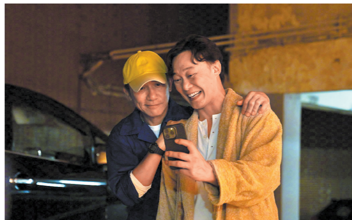
梁朝伟出演陈奕迅新歌MV