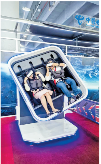
2023数字科技生态大会期间，市民正在模拟体验VR等