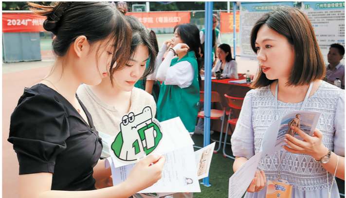
广东农业职业技术学院招聘会现场

记者了解到，今年该校毕业生6200余人，其中有超半数的学生计划参加专升本考试——这个比例高过往年同期。采访中，一名女生表示，企业开出的薪酬待遇和自己的预期尚存差