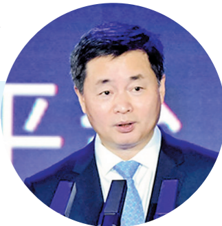
中国电信董事长柯瑞文发表主旨演讲

为聚势市场牵引、聚力创新驱动、聚力协同攻关、聚力开放合作，持续深耕卫星信息通信应用领域，在此次主论坛上，中国电信联合15家手机终端、汽车等行业共同启动卫星移动通信产业发展计划，将进一步深入挖掘卫星领域潜在价值，打造差异化竞争优势，推动空天信息产业高质量发展。