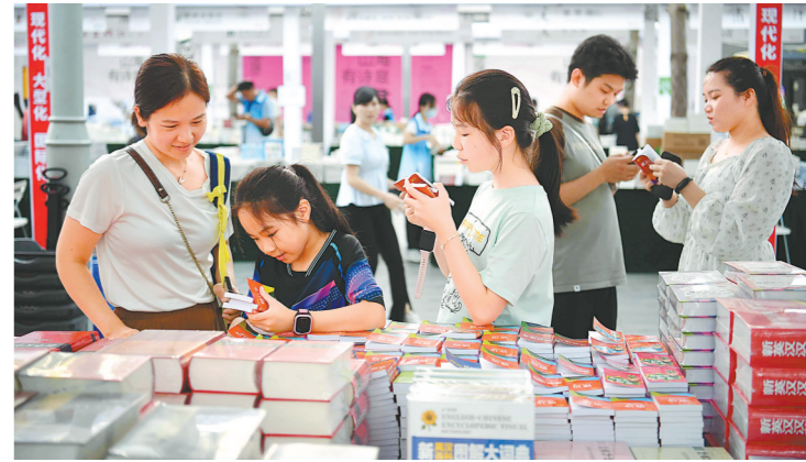
深圳市民逛书展购书

据介绍，本届书展主会场面积约50000平方米，规划10大主题展区。其中，深中展区展出